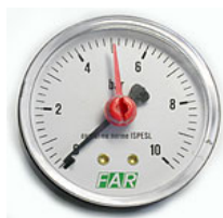
Манометр с аксиальным расположением штуцера