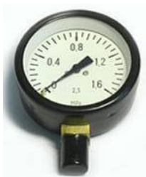
Манометр с радиальным расположением штуцера